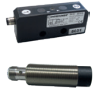
3 Polohové snímače