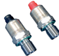
2 Snímače tlaku