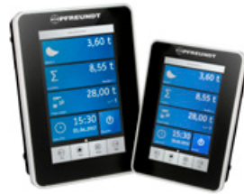
1 Vážní elektronika